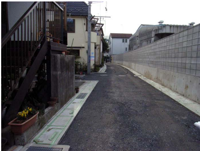
富山薬品工業裏の道路も整備され歩きやすくなりました

今議会で、私の所属する建設環境常任委員会での道路関係議案（認定、廃止、変更）の79路線のうち、実に55路線が水谷東3丁目関連でした。地権者の協力や町会長さんを初めとする関係者皆様のご苦勞によりこのように整備されました。これは安全なまちづくりに大きな効果になると思います。今後は防災空地の確保が望まれますが、私も地域の方々と一緒に実現に向けて努力いたします。