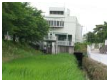
別所ポンプ場にはもう一機ポンプを増設するスペースがあります。

まず雨水対策です。坂上の水子地域の市街化編入により多くの家が建ち始めています。これにより以前の畑が持っていた保水能力が失われ、近年多発しているゲリラ豪雨の際には私たちの地域に一気に流下しかつてのような水害の再発が危惧されます。そのために、さくら記念病院先の浦所街道下をくぐる別所雨水幹線の整備やポンプ場のポンプ増設を強く訴えました。